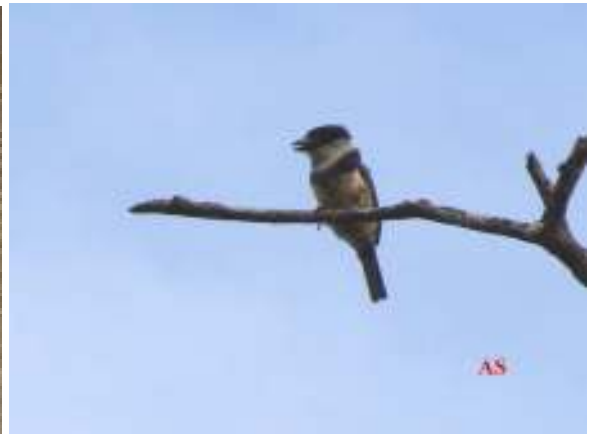
Hydropsalis albicollis ; Bacurau; Pauraque Notharchus swainsoni ; Macuru-de-barriga-castanha; Buff-bellied Puffbird