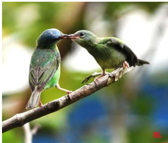
Dacnis cayana ; Saí-azul; Blue Dacnis