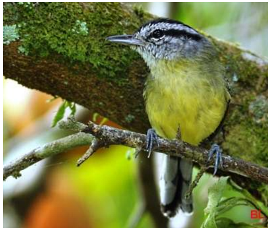
Herpsilochmus rufimarginatus ; Chorozinho-de-asa-vermelha; Rufous-winged Antwren

Avifauna do Guaraú, município de Peruíbe, São Paulo, Brasil.