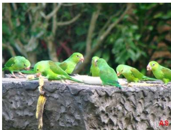
Brotogeris tirica ; Periquito-rico; Plain Parakeet