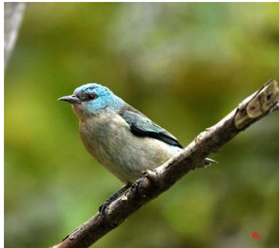
Dacnis nigripes ; Saí-de-pernas-pretas; Black-legged Dacnis