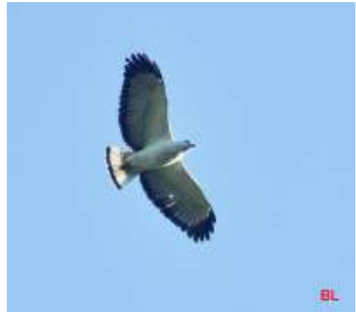
Picumnus temminckii ; Pica-pau-anão-de-coleira; Ochre-collared Piculet Amadonastur lacernulatus ; Gavião-pombo-pequeno; White-necked Hawk