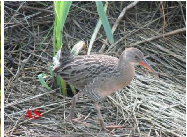
Rallus longirostris ; Saracura-matraca; Clapper Rail