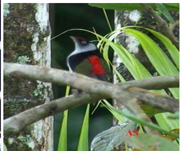
Aphantochroa cirrochloris ; Beija-flor-cinza; Sombre Hummingbird Ilicura militaris ; Tangarazinho; Pin-tailed Manakin