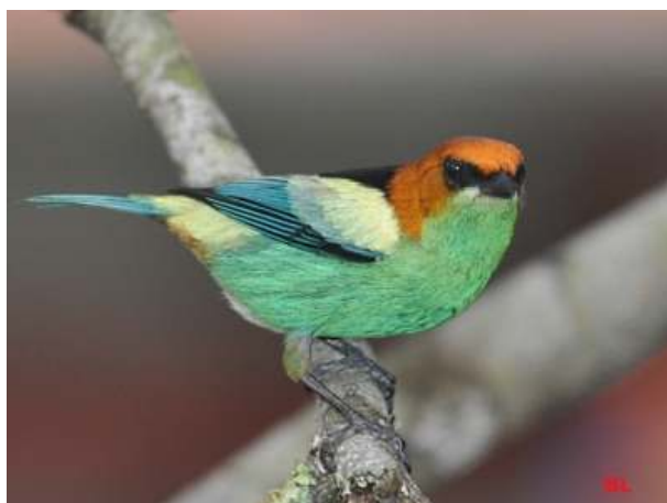
Tangara peruviana ; Saíra-sapucaia; Black-backed Tanager