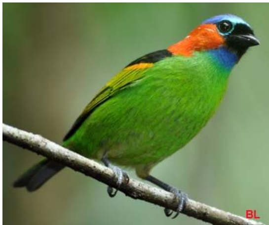
Tangara cyanocephala ; Saíra-militar; Red-necked Tanager