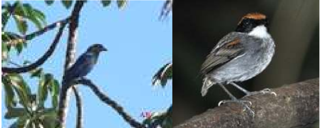
Cyanocorax caeruleus ; Gralha-azul; Azure Jay Conopophaga melanops ; Cuspidor-de-máscara-preta; Black-cheeked Gnatcatcher