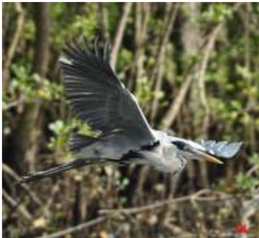
Ardea cocoi ; Garça-moura; Cocol Heron