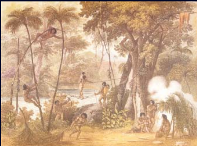
J. M. Rugendas - Pont de Lianne - 1825

"...por que estes homens são livres e ezentos da minha jurisdição, que os não pode obrigar a sahirem das suas terras para tomarem hum modo de vida de que elles se não agradão, o que se não he rigorozo captiveiro, em certo modo o parece, porque offende a liberdade".