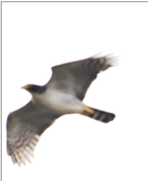
Figura 02: Mesmo indivíduo, sobrevoando a região.