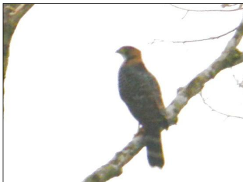
Figura 04: Imaturo de Tauató-pintado.

www.ultimaarcadenoe.com.br Registro documentado de Tauató-pintado ( Accipiter poliogaster ) no Município de Peruíbe, São Paulo. Brasil